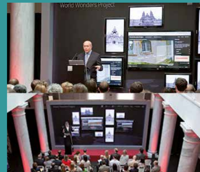
Ponencia del Ministro de Educación de España.