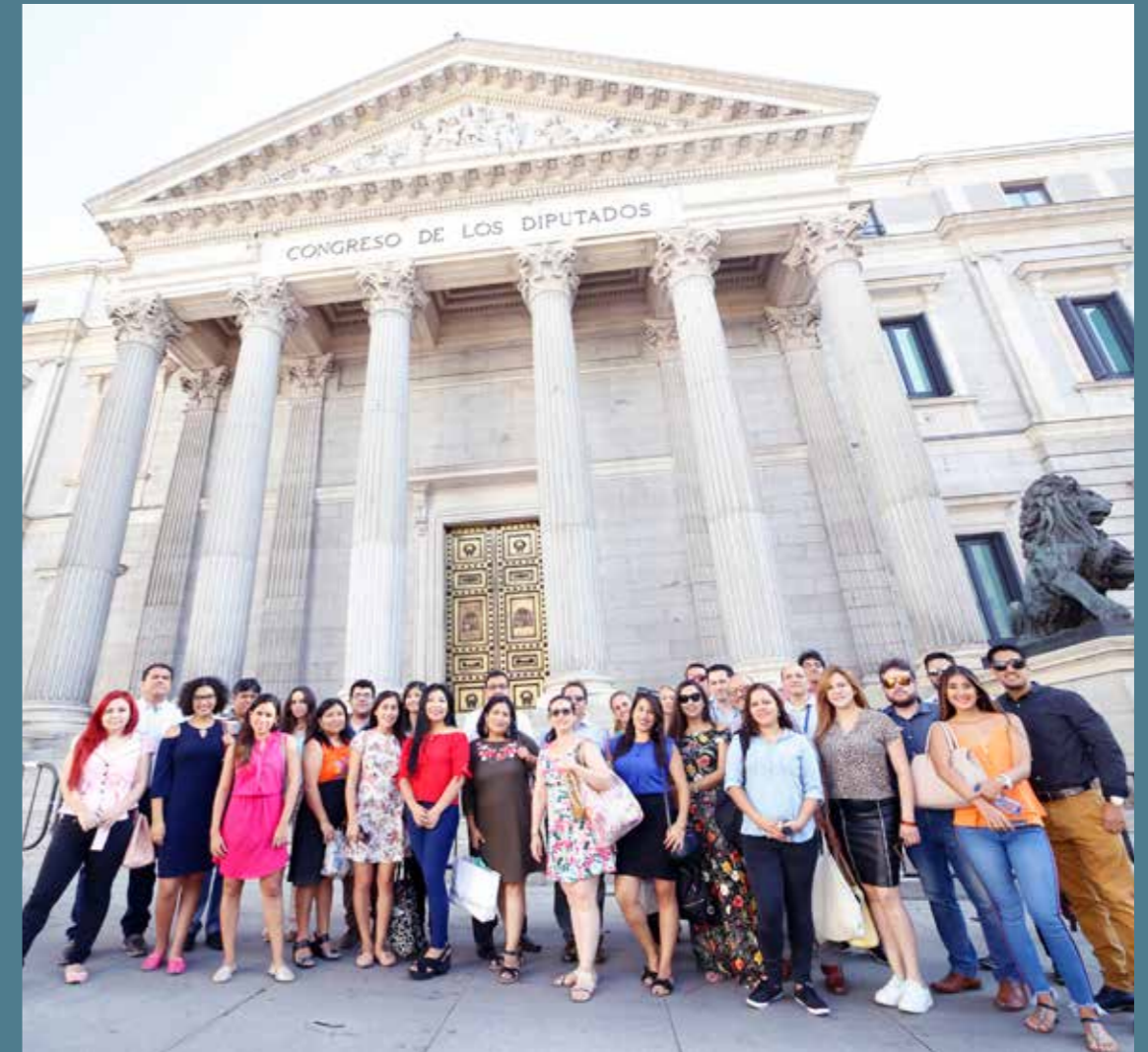
Visita de los alumnos de la Estancia Internacional al Congreso de los Diputados