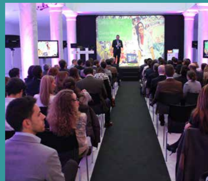
Jornadas de Microsoft.