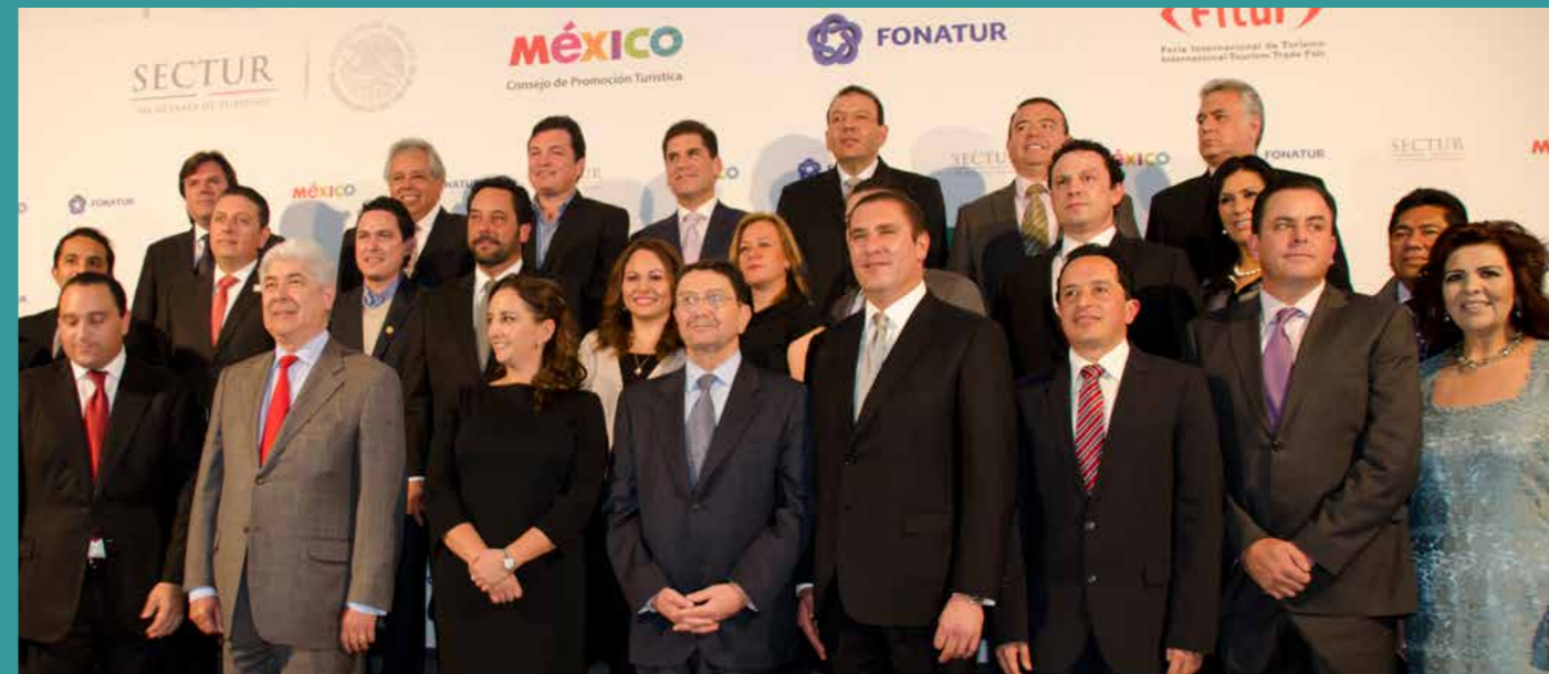
Presentación de la marca México con motivo de Fitur en el Palacio Neptuno.