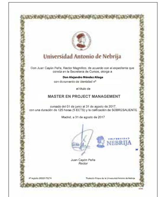
Título Propio de la Universidad Antonio de Nebrija