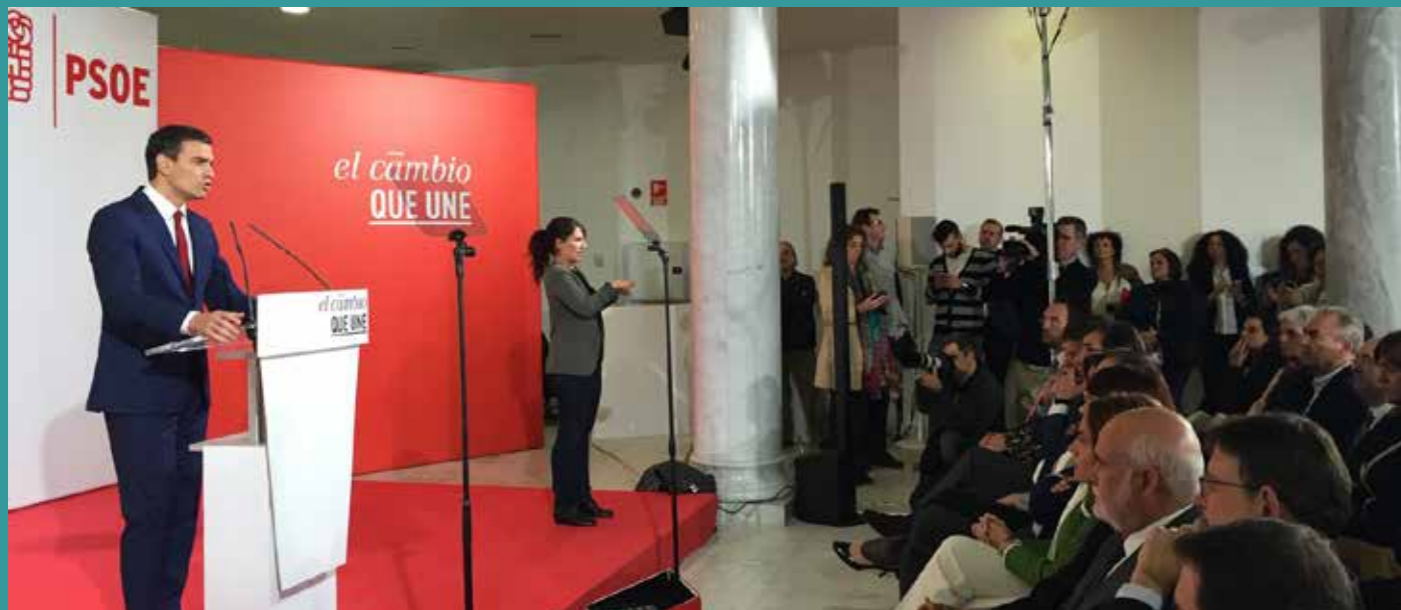
El Presidente del Gobierno, Pedro Sánchez, en el evento del PSOE "El cambio que une" en el Palacio Neptuno.