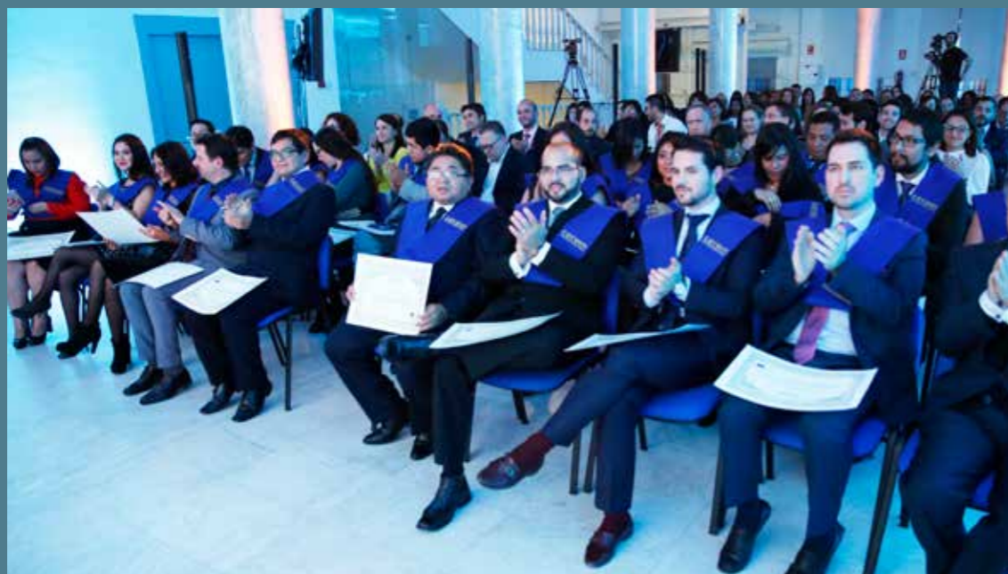
Acto de Graduación en la Sede Central de Cerem (Palacio Neptuno)

Consta de 80 horas lectivas entre clases presenciales y visitas a empresas. Las clases son impartidas por los profesores de la Escuela además de contar con importantes invitados del mundo empresarial como especialistas de las diferentes áreas de gestión.