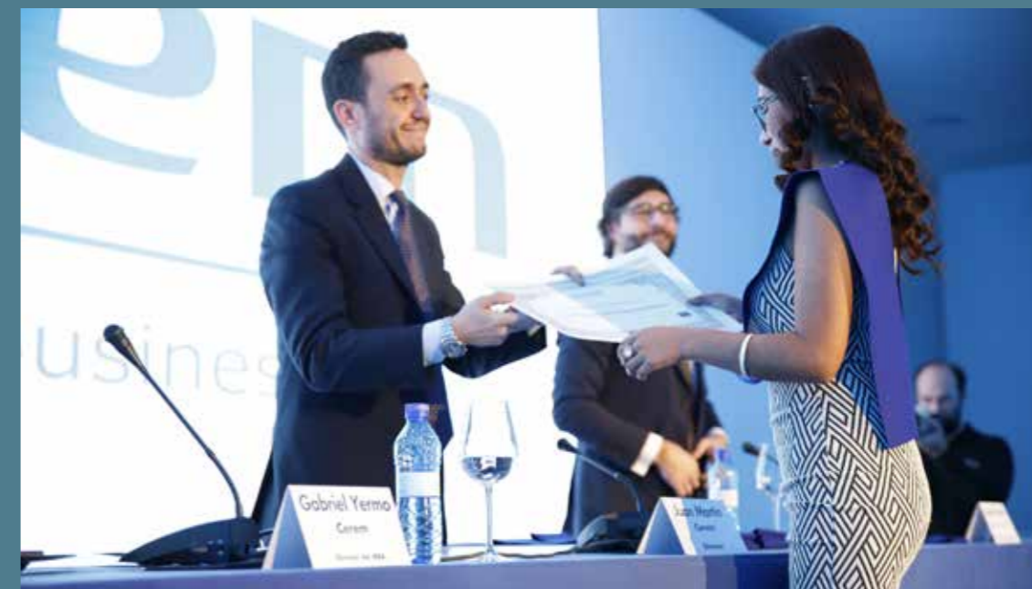
Entrega de Títulos de la Estancia Internacional

Una vez finalizada la Estancia el alumno recibirá el Título de la Estancia Internacional de Desarrollo Directivo con un Certificado de Estancia en Europa.