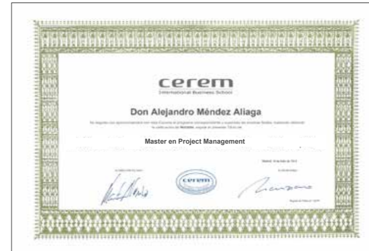
Título Propio de Cerem International Business School

Para la obtención del Título de la Universidad Nebrija hay que realizar un Trabajo final de Master (TFM).