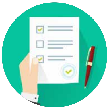
Solicitud de Admisión